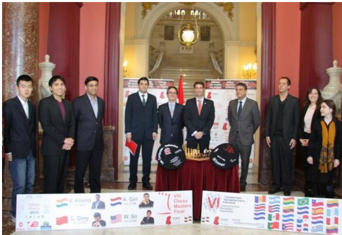
Presentación en el Ayuntamiento de Bilbao

El evento se disputó en el Teatro Campos Elíseos de Bilbao, en paralelo y compartiendo escenario con el torneo de super elite Bilbao Chess Master 2015, donde tomaban parte el excampeón mundial Vishy Anand y otros destacados jugadores del top ten mundial.