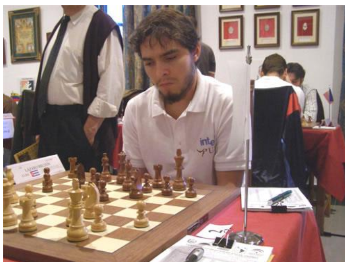
El vencedor fue el Gran Maestro cubano Lázaro Bruzón.