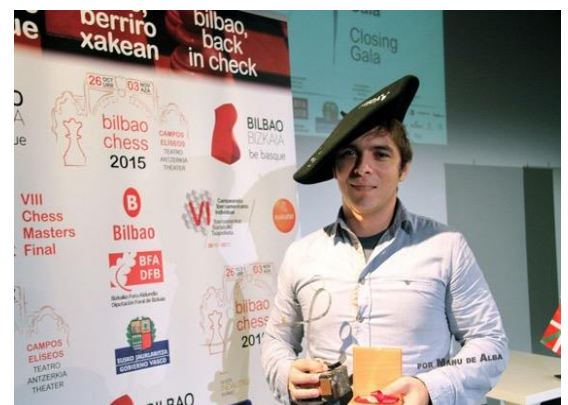
Vencedor: GM Lázaro Bruzón (Cuba)